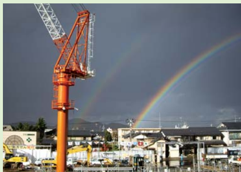
雨上がりに2重の虹が現れました