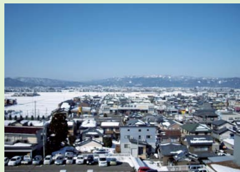
クレーンから見える雪景色