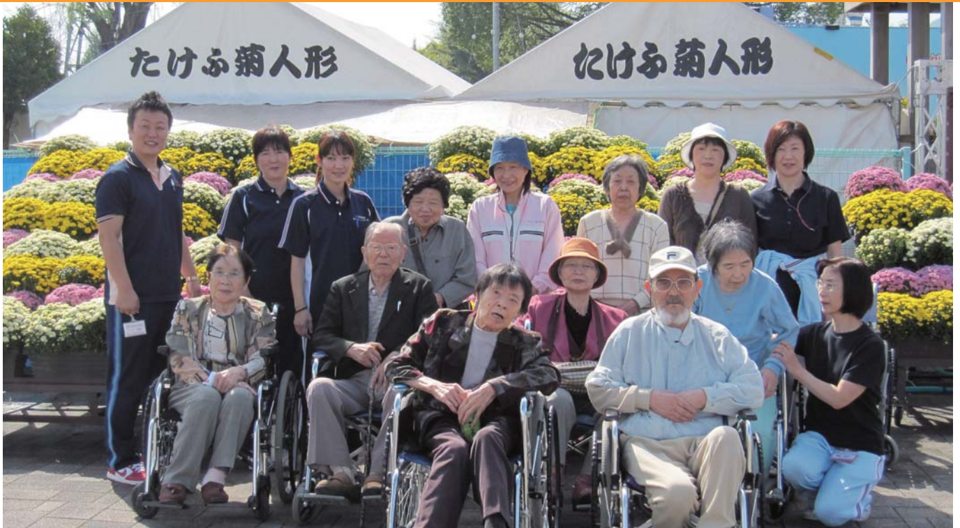
なごみの里で外出しました