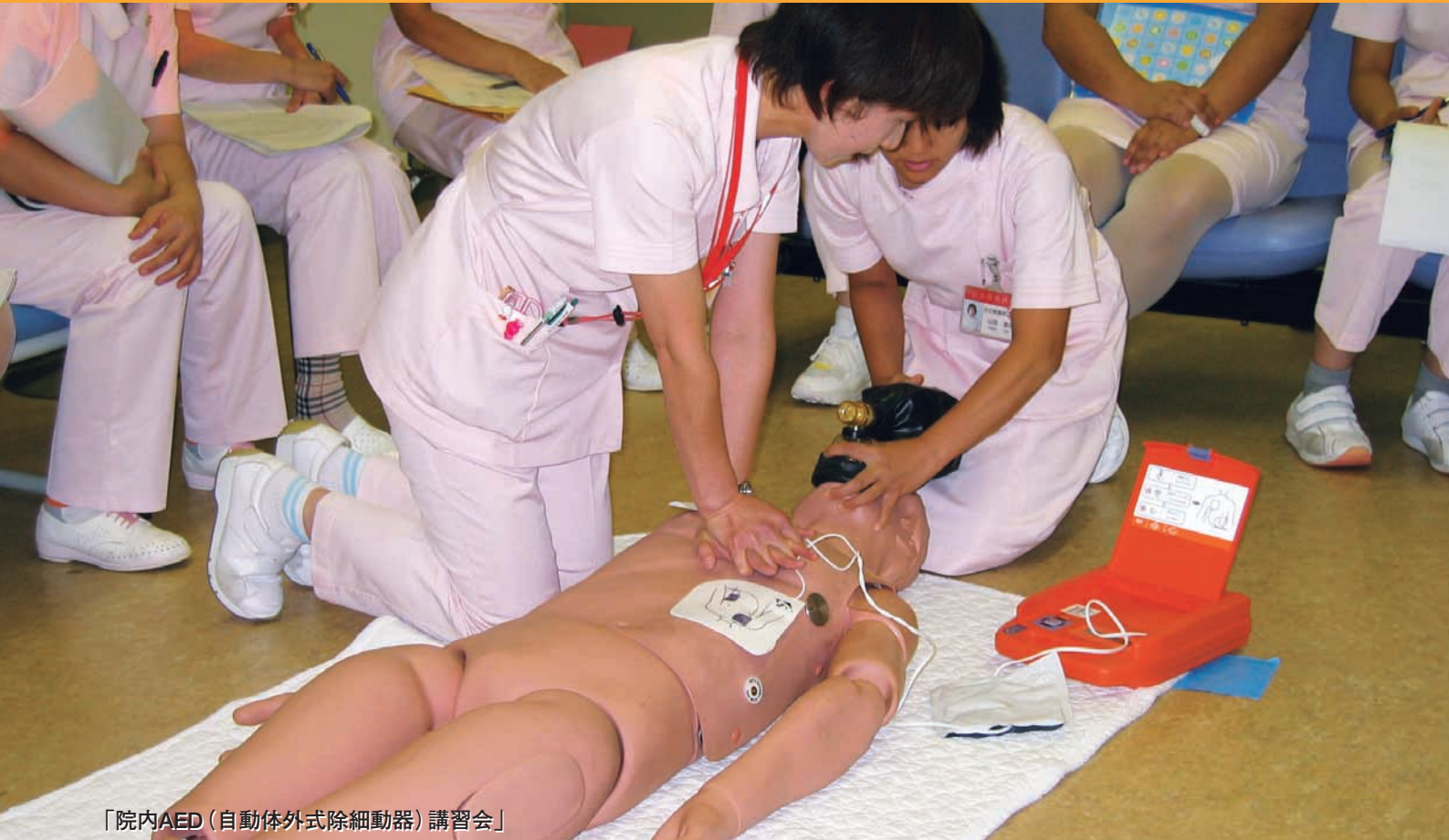
「院内AED（自動体外式除細動器）講習会」